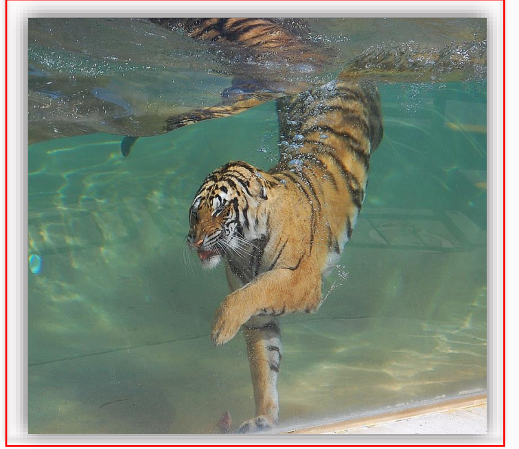
புலி நீரில் நீந்தும் காட்சி